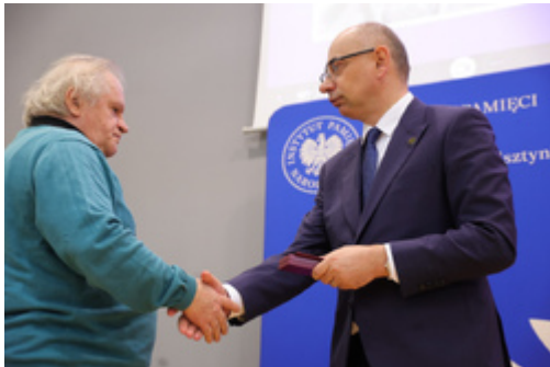
W Olsztynie uhonorowaliśmy dawnych opozycjonistów – 17 kwietnia 2026.

Zwieńczeniem uroczystości był koncert Chóru Liceum Ogólnokształcącego nr 1 im. Jana Bażyńskiego „COLLEGIUM VOCALE” pod batutą Joanny Jaskółowskiej.