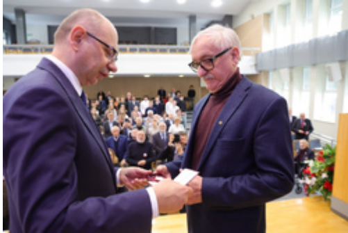
W Olsztynie uhonorowaliśmy dawnych opozycjonistów – 17 kwietnia 2026.