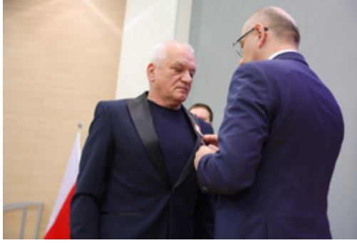
W Olsztynie uhonorowaliśmy dawnych opozycjonistów – 17 kwietnia 2026.